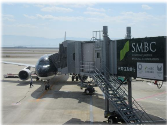
ボーディングブリッジその2

今後は、「エレベーター」、「カームダウン・クールダウン」(外部の音をなるべく遮り、外気温や湿度に左右されず、気持ちを落ち着かせることが必要になる方々が利用できる個室)、「トイレ」、「保安検査」に分かれてフォローアップ会議が行われます。バリアフリーが少しでも前へ進めていけるように働きかけをします。