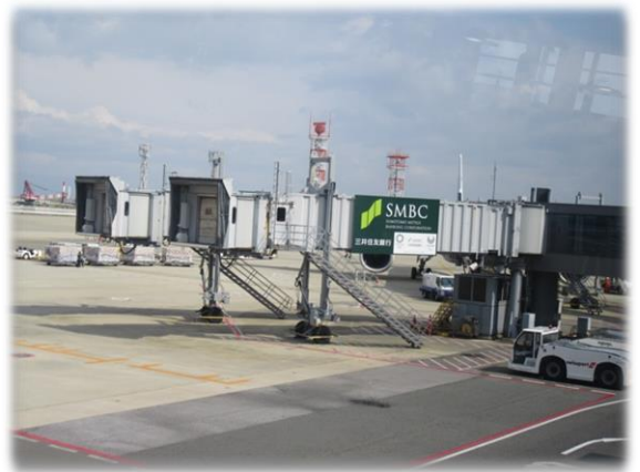
ボーディングブリッジその1

「自分の車椅子で飛行機までいけなかった」というのは、車椅子の利用をしている方は、体に合わせて使用しており、預かり所で空港施設の車椅子に乗り換えることで、身体が不安定になり、調子を崩される方がいます。視察を行った羽田空港では、自分の車椅子で飛行機の中までいけるようになっており、ボーディングブリッジにエレベーターの設置が当事者からの提案がありました。これ以外にも検討会を積み重ねることで、300件の課題が上がりました。